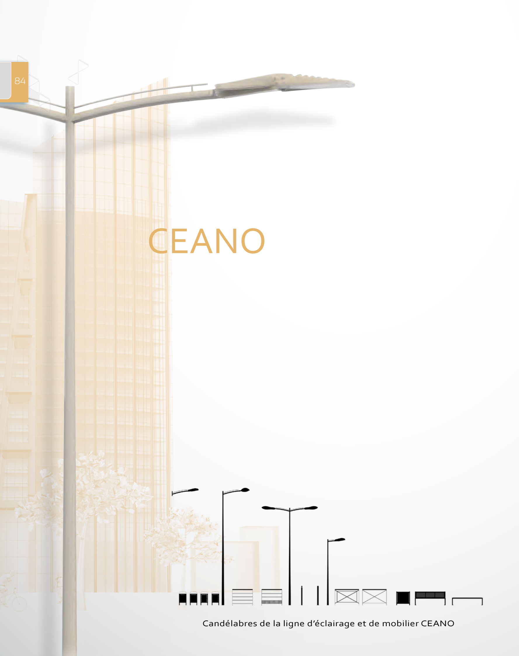
Candélabres de la ligne d'éclairage et de mobilier CEANO